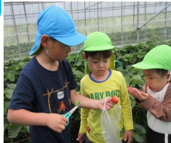
りす組ときりん組～いちご狩り